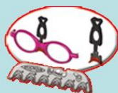
Piastrina per 6 forme di nasello